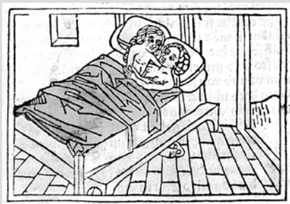
Guido de Columna. Hystori wie Troya zerstört ward. 1482.

Wertvolle Bücher & Autographen Literatur & Buchillustration des 17.-19. Jhdts. · Moderne Literatur